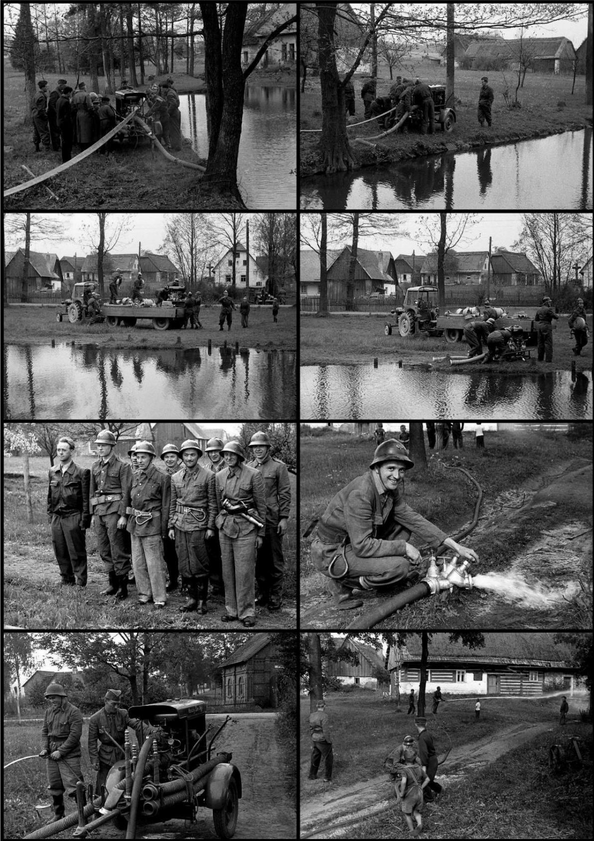
Více fotografií najdete na: https://ouhajnice.rajce.idnes.cz/